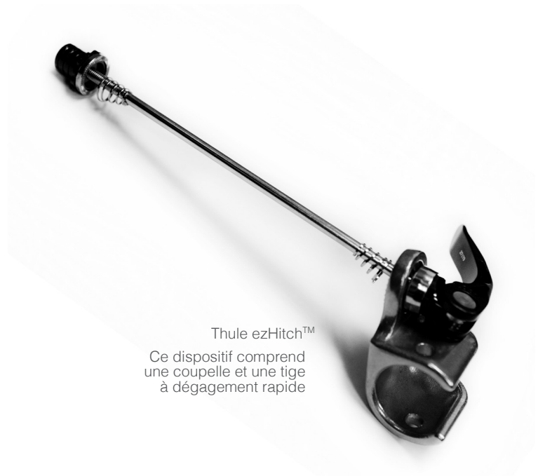
Thule ezHitch™ Ce dispositif comprend une coupelle et une tige à dégagement rapide