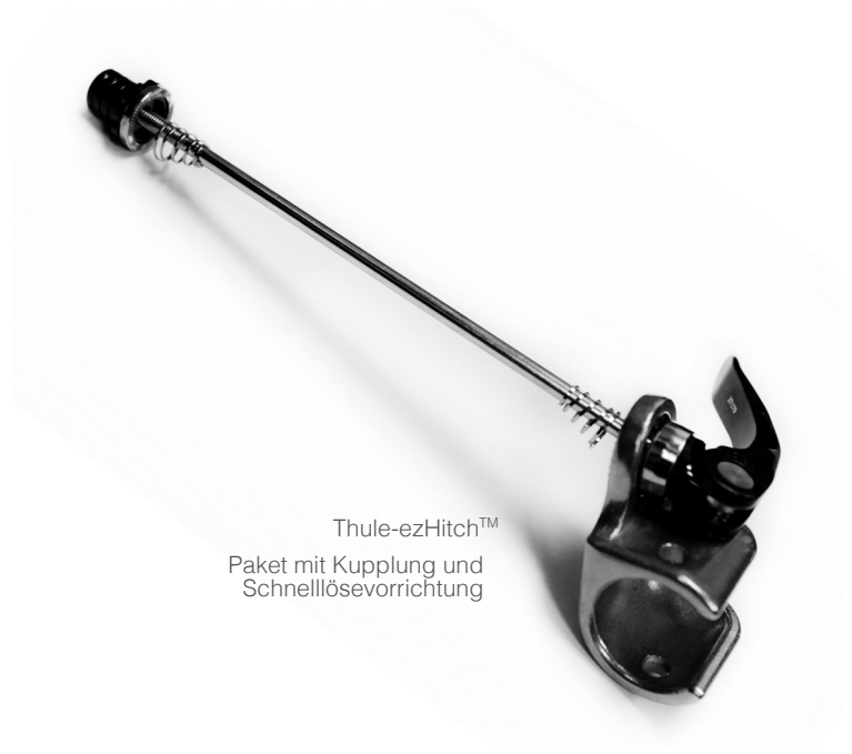
Thule-ezHitch™ Paket mit Kupplung und Schnellösevorrichtung